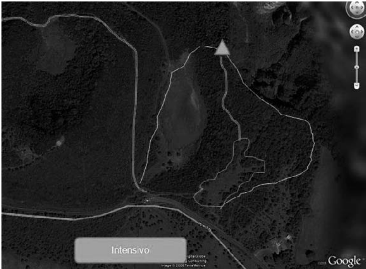
Zonas de Uso Extensivo e Intensivo en el Sector Cráteres