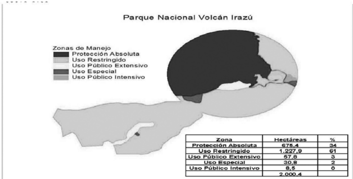
Zonificación del Parque Nacional Volcán Irazú