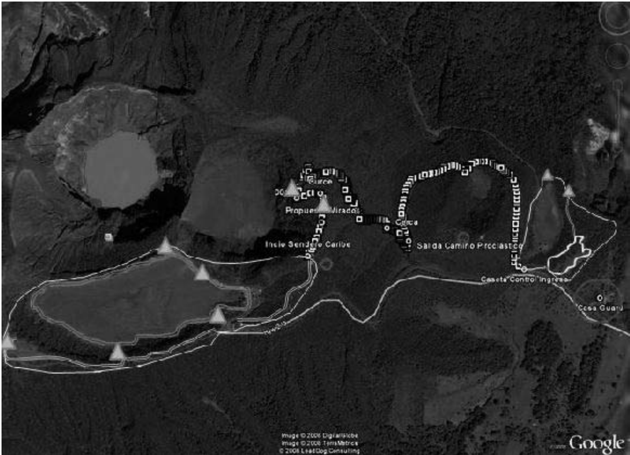
Zona de Uso Público Sector Cráteres del Parque Nacional Volcán Irazú