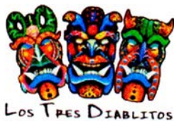
LOS TRES DIABLITOS