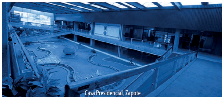
Casa Presidencial, Zapote