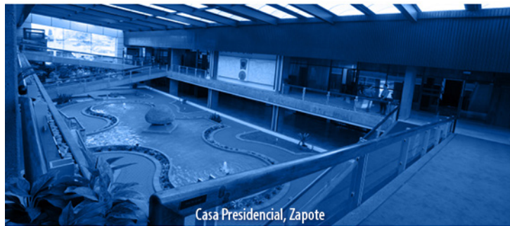
Casa Presidencial, Zapote

RODRIGO CHAVES ROBLES.—La Ministra de Educación Pública, Anna Katharina Müller Castro; el Ministro de Justicia y Paz, Gerald Campos Valverde y el Ministro de Trabajo y Seguridad Social, Andrés Romero Rodríguez.—1 vez.—Exonerado.—( L10454 – IN2024859785 ).