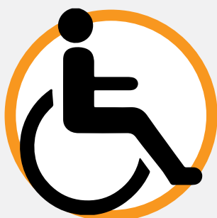
PERSONA CON DISCAPACIDAD