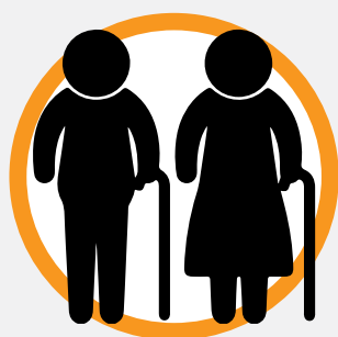
PERSONA ADULTA MAYOR