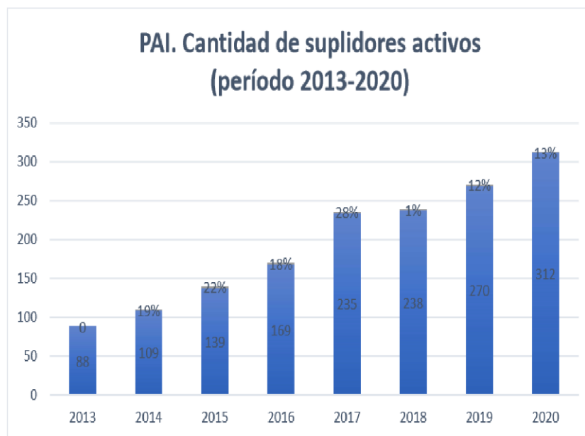
CUADRO N.º 2

La ampliación del mercado institucional ha favorecido a las organizaciones de productores, algunas de las cuales, como por ejemplo, la asociación de productores indígenas Aditica de Talamanca, que cobija 245 familias, en el 2021, ha colocado en el mercado PAI, cerca de 52 millones de colones con la venta de plátano, el Centro Agrícola Cantonal de Alvarado, que cuenta con una base de aproximadamente 2 mil productores y coloca cerca de 2 mil millones de colones anuales en el PAI, o la Asociación de Productores de Frijol de Veracruz de Pérez Zeledón que coloca toda su producción frijolera a través de este mercado