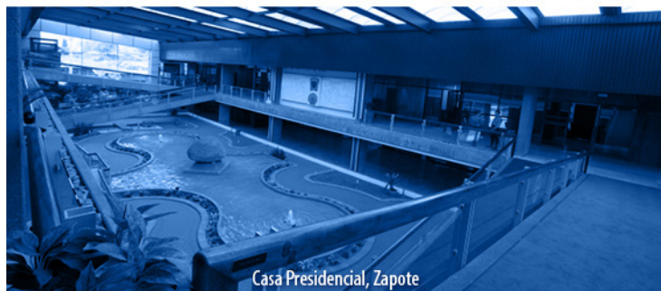
Casa Presidencial, Zapote