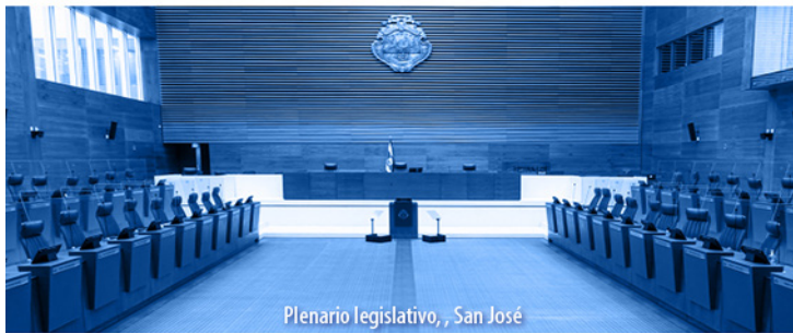
Plenario legislativo, San José