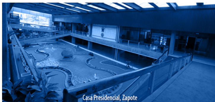
Casa Presidencial, Zapote

NOTA: Este proyecto aún no tiene comisión asignada. 1 vez.—Exonerado.—( IN2021593400 ).