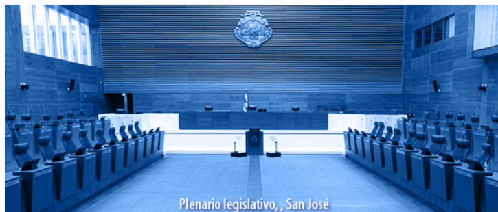
Plenario legislativo, San José