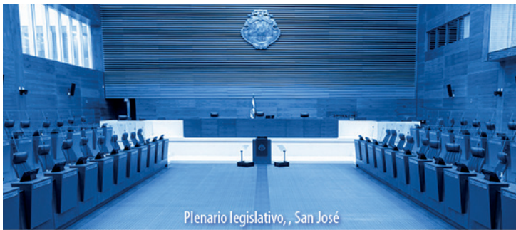
Plenario Legislativo, San José

El Alcance N° 33, a La Gaceta N° 32; Año CXLIV, se publicó el jueves 17 de febrero del 2022.