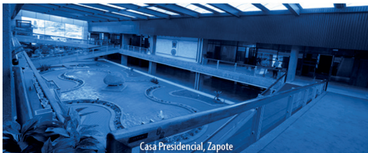
Casa Presidencial, Zapote

NOTA: Este proyecto aún no tiene comisión asignada. 1 vez.—Exonerado.—( IN2022624150 ).