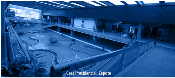
Casa Presidencial, Zapote