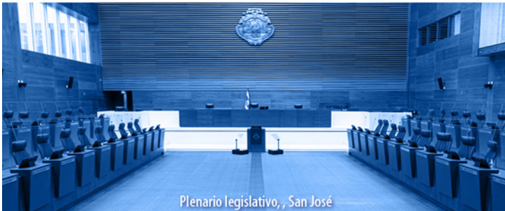
Plenario legislativo, San José

El Alcance N° 41, a La Gaceta N° 38; Año CXLIV, se publicó el viernes 25 de febrero del 2022.