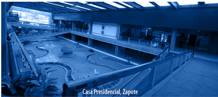
Casa Presidencial, Zapote