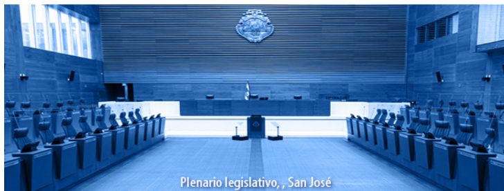
Plenario legislativo, San José

Los Alcances N° 88, N° 89 y N° 90, a La Gaceta N° 83; Año CXLIV, se publicaron el viernes 6 de mayo del 2022.