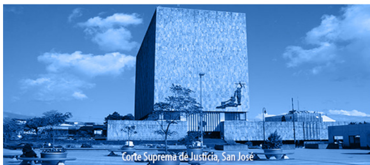
Corte Suprema de Justicia, San José