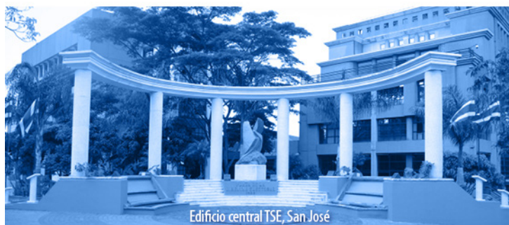
Edificio central TSE, San José