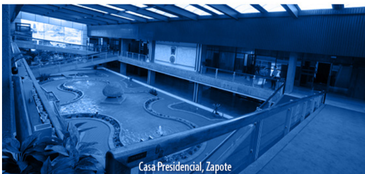
Casa Presidencial, Zapote