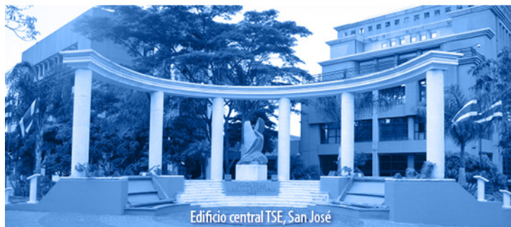
Edificio central TSE, San José

ED-0404-2022.—Exp. 23128.—Imperial Maya Group Sociedad Anónima, solicita concesión de: 0.08 litros por segundo del nacimiento naciente sin nombre, efectuando la captación en finca de Imperial Maya Group Sociedad Anónima, en Pavón, Golfito, Puntarenas, para uso agropecuario, comercial, consumo humano, agropecuario-riego y turístico. Coordenadas 40.778 / 632.145 hoja Pavón. Quienes se consideren lesionados, deben manifestarlo dentro del mes contado a partir de la primera publicación.—San José, 20 de mayo de 2022.—Departamento de Información.—Marcela Chacón Valerio.—( IN2022647609 ).