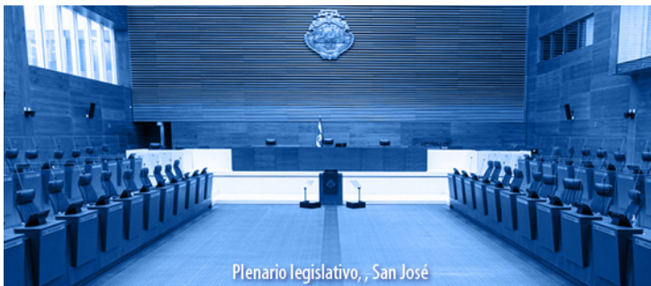
Plenario legislativo, San José

El Alcance N° 126, a La Gaceta N° 117; Año CXLIV, se publicó el jueves 23 de junio del 2022.