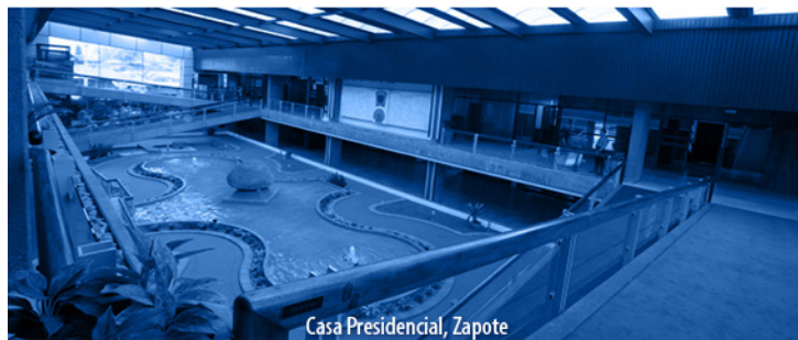
Casa Presidencial, Zapote

NOTA: Este proyecto aún no tiene comisión asignada. 1 vez.—Exonerado.—( IN2022655303 ).