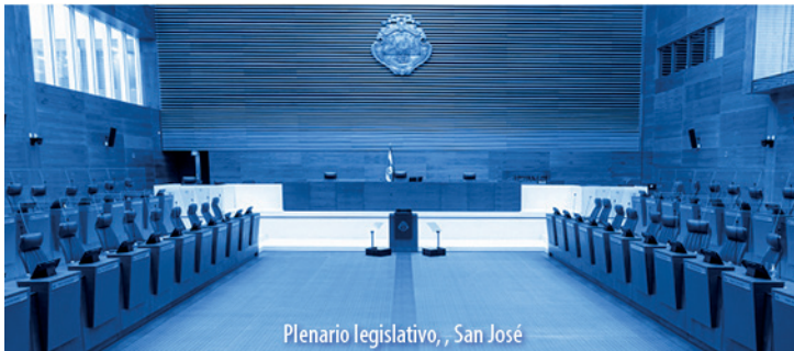
Plenario legislativo, San José