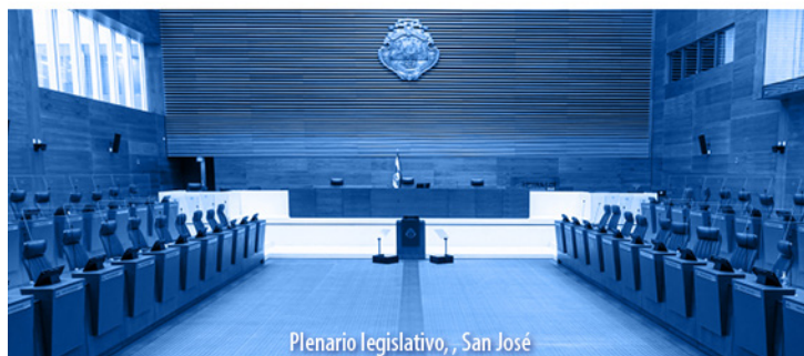
Plenario legislativo, San José