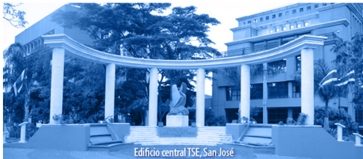
Edificio central TSE, San José