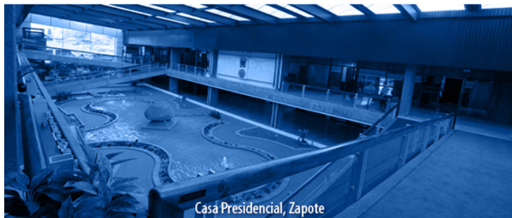
Casa Presidencial, Zapote

El Alcance N° 278, a La Gaceta N° 243; Año CXLIV, se publicó el miércoles 21 de diciembre del 2022.