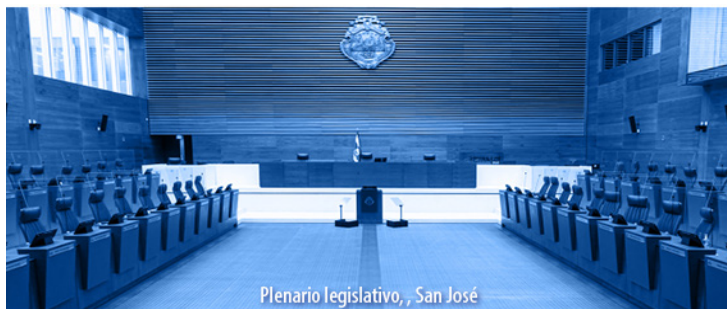
Plenario legislativo, San José

El Alcance N° 280, a La Gaceta N° 244; Año CXLIV, se publicó el jueves 22 de diciembre del 2022.