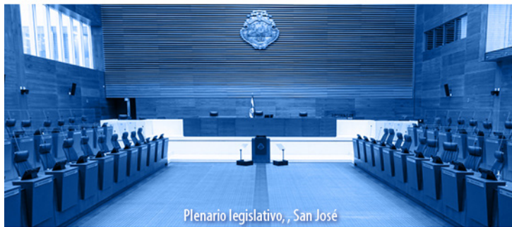
Plenario Legislativo, San José