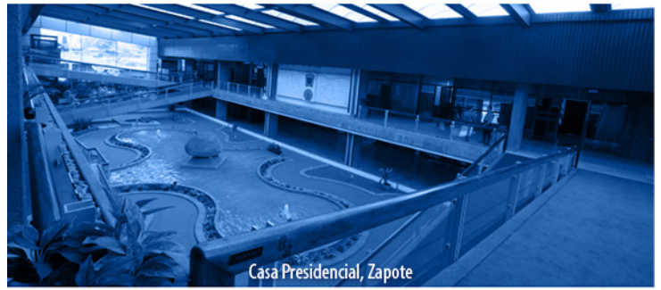
Casa Presidencial, Zapote