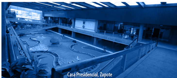
Casa Presidencial, Zapote