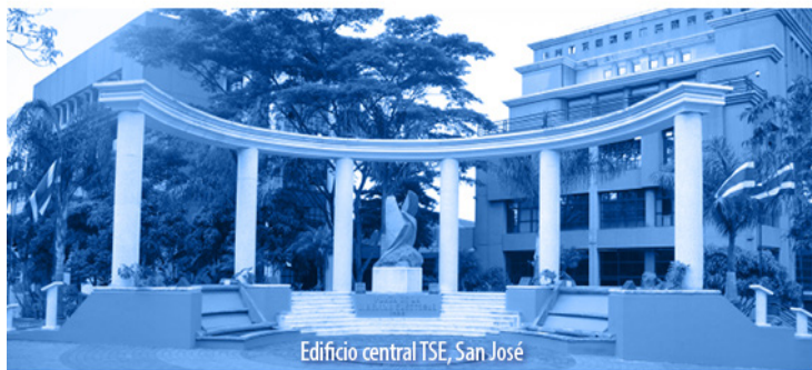
Edificio central TSE, San José

en finca de su propiedad en Nacascolo, Liberia, Guanacaste, para uso agropecuario - brevadero, agropecuario - riego y turístico- hotel- piscina recreativa. Coordenadas 295.701 /360.954 hoja ahogados.. Quienes se consideren lesionados, deben manifestarlo dentro del mes contado a partir de la primera publicación.—Liberia, 23 de febrero de 2023.—Unidad Hidrológica Tempisque, Pacífico Norte.—Silvia Mena Ordóñez.—( IN2023729620 ).