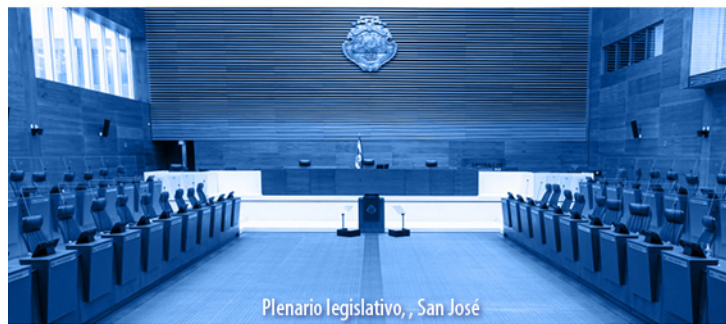
Plenario legislativo, San José