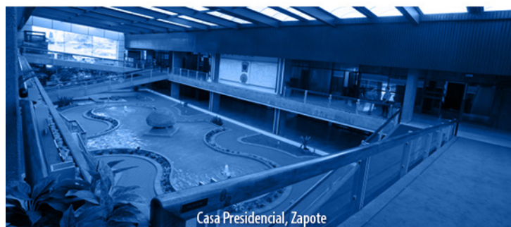
Casa Presidencial, Zapote