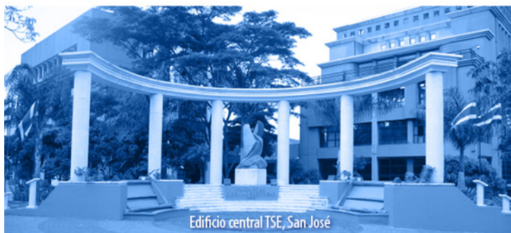
Edificio central TSE, San José