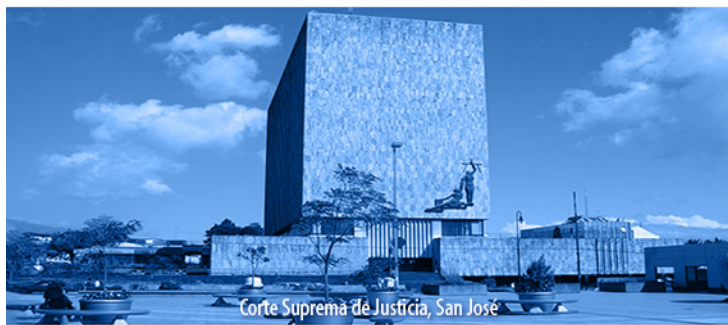
Corte Suprema de Justicia, San José