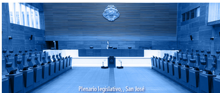
Plenario legislativo, San José