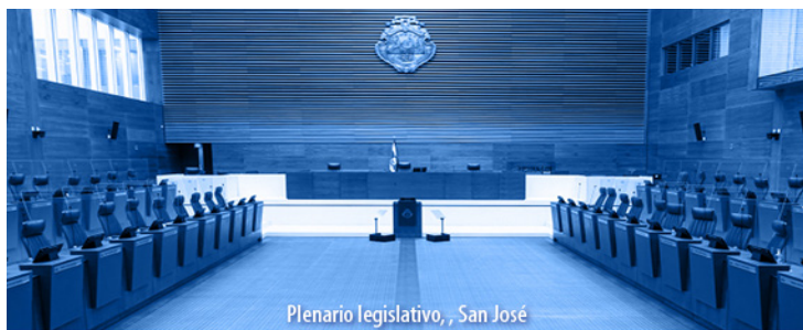
Plenario legislativo, San José

El Alcance N° 137, a La Gaceta N° 131; Año CXLV, se publicó el miércoles 19 de julio del 2023.