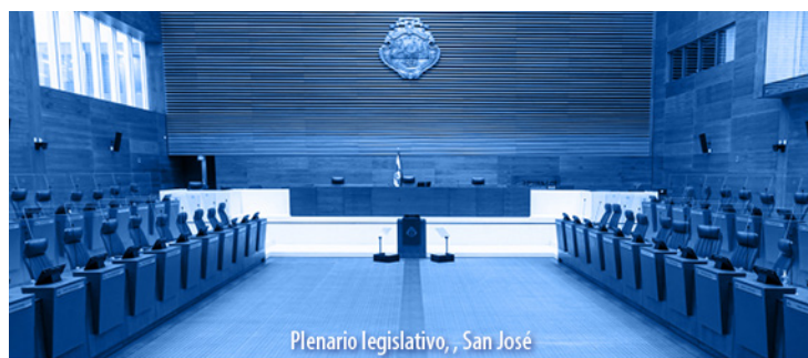
Plenario legislativo, San José

Los Alcances N° 161 y N° 162, a La Gaceta N° 155; Año CXLV, se publicaron el viernes 25 de agosto del 2023.