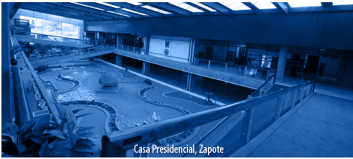
Casa Presidencial, Zapote