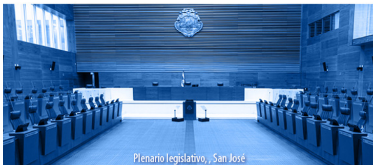
Plenario legislativo, San José

Turrialba, tres de noviembre del año 2023.—1 vez.— ( IN2023823555 ).