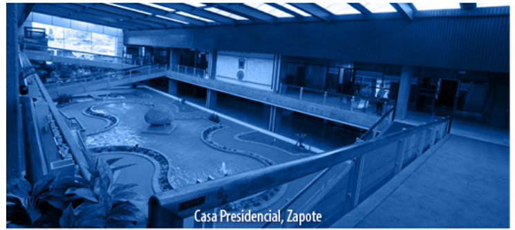
Casa Presidencial, Zapote