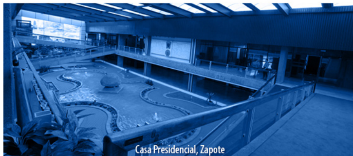
Casa Presidencial, Zapote

NOTA: El expediente legislativo aún no tiene comisión asignada. 1 vez.—Exonerado.—( IN2024846019 ).