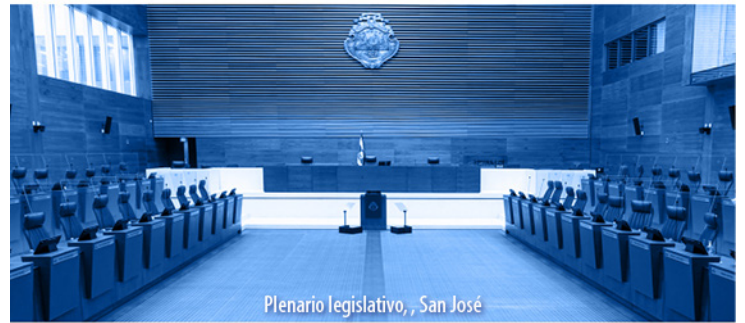
Plenario legislativo, San José