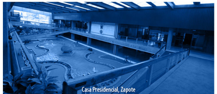
Casa Presidencial, Zapote

NOTA: El expediente legislativo aún no tiene comisión asignada. 1 vez.—Exonerado.—( IN2024846360 ).