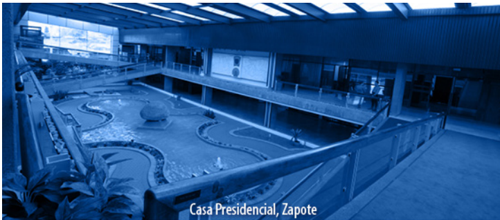
Casa Presidencial, Zapote

Los Alcances N° 87 y N° 88, a La Gaceta N° 80; Año CXLVI, se publicaron el martes 7 de mayo del 2024.